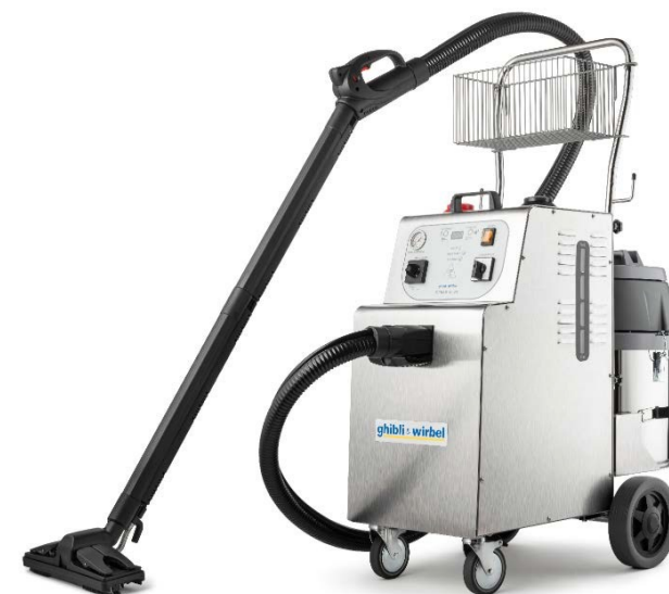
S-Team 10 VH