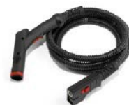
Гъвкав маркуч с дръжка (2,5 м)

Гъвкав маркуч с дръжка (2,5 м) Твърда връзка за удължаване (x2) Парна правоъгълна четка Парна триъгълна четка Съединение за дюзата Почистващ накрайник за стъкло Извита парна тръба (175 мм) Бяла кърпа от микрофибър за правоъгълна четка Плат за триъгълна четка Полиестерна кръгла четка Ø 28 Месингова кръгла четка Ø 28 Полиестерна кръгла четка Ø 40 Полиестерна кръгла четка Ø 65 Бутилка за пълнене I 1,2