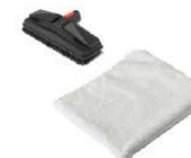
Бяла кърпа от микрофибър за правоъгълна четка