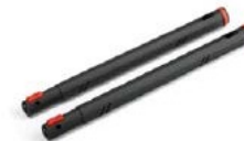
Твърда връзка за удължаване (x2) Съединение за дюзата