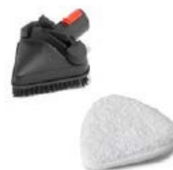
Парна триъгълна четка и плат за триъгълна четка