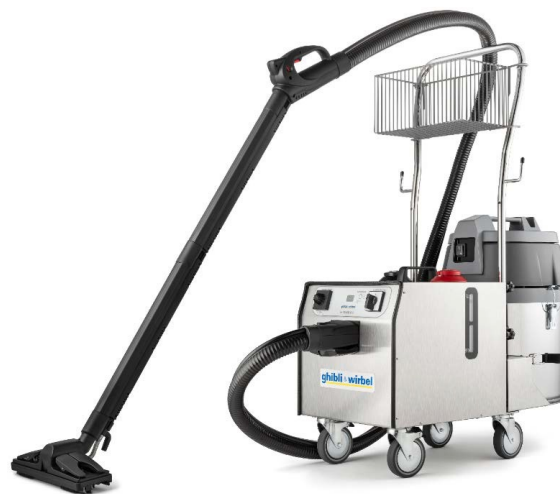
S-Team 6 V