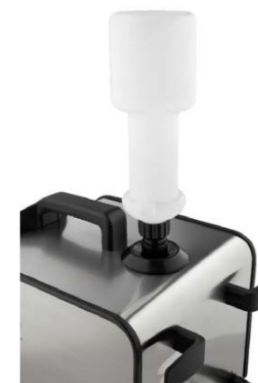
Резервоар за вода