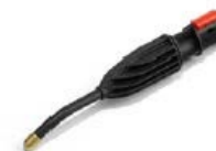
Извита парна тръба (175 мм)