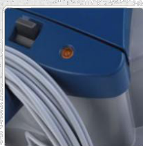
ИНДИКАТОР ЗА ПЪЛНА ТОРБА И ЗАПУШВАНЕ