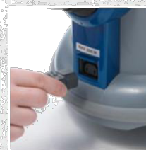
ВХОД ЗА ЕЛЕКТРИЧЕСКА ЧЕТКА