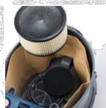
ЗАЩИТА НА МОТОРА ФИЛТЪР + НЕРА ПАТРОНЕН ФИЛТЪР