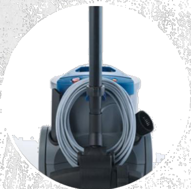
НОВА ФИКСИРАЩА СИСТЕМА