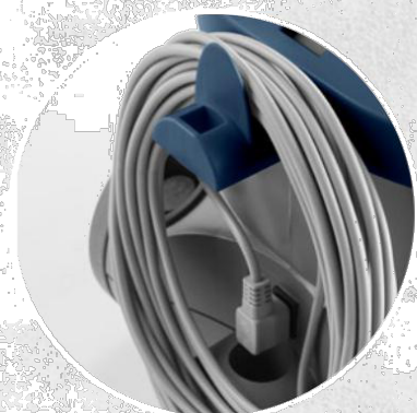
СВАЛЯЕМ КАБЕЛ 15М (СТАНДАРТНО ОБОРУДВАНЕ)

ФИЛТЪРНА ТОРБА + ТЕКСТИЛЕН ИЛИ ХЕПА ПАТРОНЕН ФИЛТЪР + ИЗХОДЯЩ ВЪЗДУШЕН ФИЛТЪР