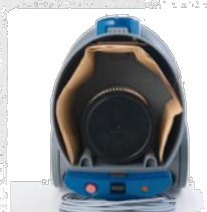
ВЪТРЕШЕН КОНТЕЙНЕР СЪС СТРАХОТНИ РАЗМЕРИ