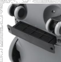
ФИЛТЪР ЗА ИЗХОДЯЩ ВЪЗДУХ